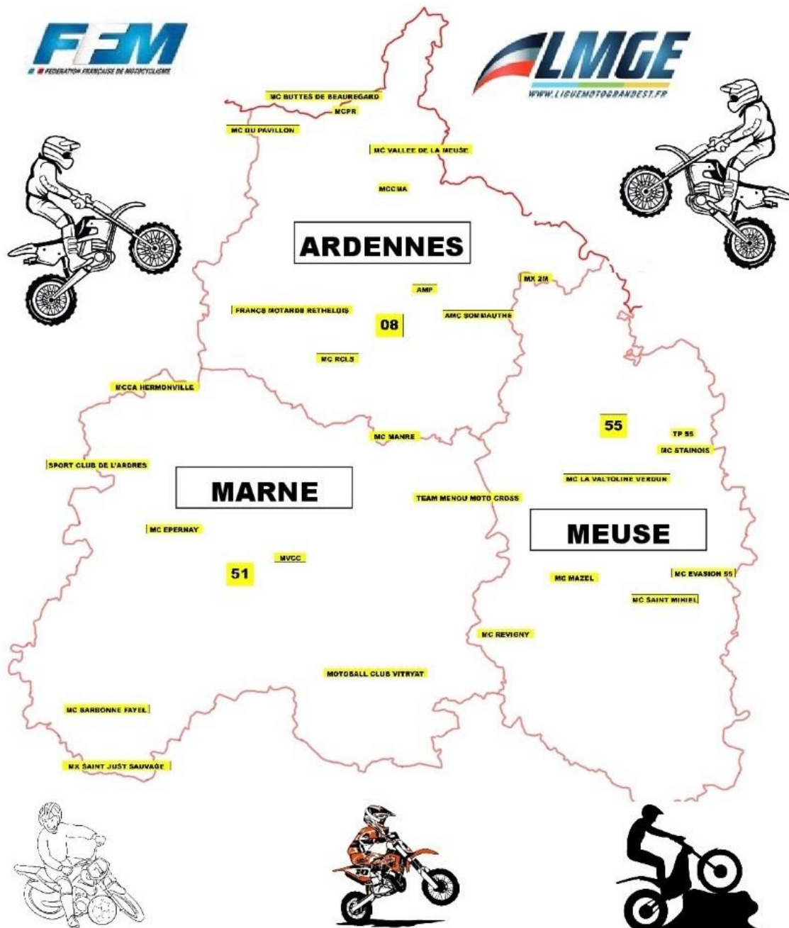
carte : G LEVEQUE

Conscients que les pilotes auront de moins en moins de moyens pour effectuer de grands déplacements, 3 départements du Nord Est ont décidé de se « regrouper » pour proposer à leurs licenciés FFM, des championnats de proximité. Grace au dynamisme de leurs clubs respectifs, chaque discipline devrait proposer un calendrier attrayant (+ très prochainement).